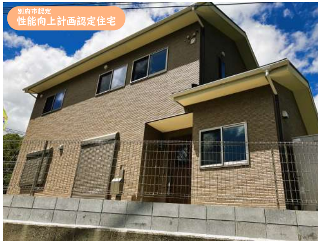
別府市認定 性能向上計画認定住宅